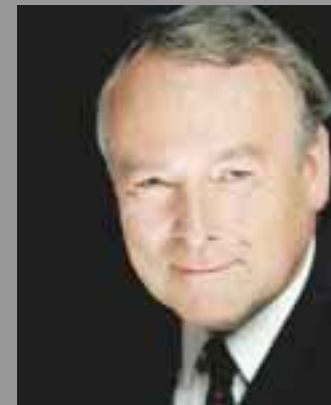
Bürgermeister Hartmut Perschau Senator für Wirtschaft und Häfen Aufsichtsratsvorsitzender der Bremer Investitions-Gesellschaft mbH

Der Aufsichtsrat hat die ihm nach Gesetz und Satzung obliegenden Aufgaben wahrgenommen. Im Geschäftsjahr 2003 ist er zu drei Sitzungen zusammengekommen.