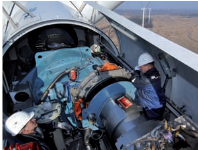
Die Monteure von AN-Windenergie arbeiten in schwindelnder Höhe.

» Ein erfolgreicher Mittelständler, ein weltweit agierender Konzern, eine langfristige, erfolgreiche stille Beteiligung und ein deutliches Bekenntnis zum Wirtschafts- und Windstandort Bremen – all diese Komponenten verbergen sich hinter der Übernahme der Bremer AN Windenergie GmbH durch den Siemens-Konzern mit seiner Tochter Siemens Wind Power GmbH zum Ende des vergangenen Jahres. Eine Übernahme, die langfristig den Windstandort Bremen sichert und ein erfolgreiches Beispiel für die Förderung einer Schlüsseltechnologie durch die Wirtschaftsförderung darstellt. Die Bremer Aufbau-Bank GmbH hat über die Bremer