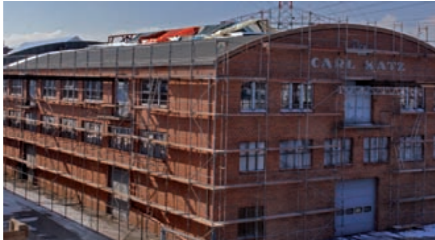
Die historische Tonnendachhalle wird zum modernen Dienstleistungszentrum.