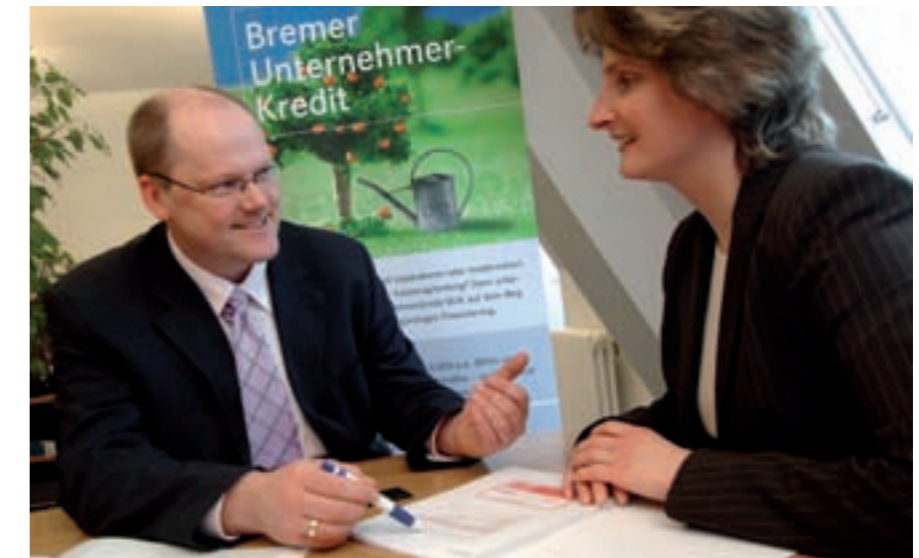
Das ausführliche Beratungsgespräch ist Basis für die Kreditvergabe.

»Mit der Auflage des Bremer Unternehmerkredits haben die Wirtschaftsförderer der BIG-Gruppe ins Schwarze getroffen: Der attraktive Kredit für Existenzgründer, mittelständische Unternehmen und Freiberufler erfreut sich großer Nachfrage. Binnen drei Monaten konnten an mehr als 50 Antragsteller insgesamt rund 14 Mio. Euro vergeben werden. Der Kredit, der seit Oktober 2005 bei der Bremer Aufbau-Bank GmbH zu günstigen Konditionen beantragt werden kann, zeigt sich als gewinnbringendes Medium für den Wirtschaftsstandort. So konnten 40 neue Arbeitsplätze geschaffen, rund 2.000 Arbeitsplätze gesichert sowie 16 Existenzgründungen ermöglicht werden. <<<