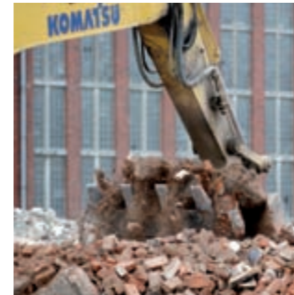
Abrissbagger schaffen Platz.

» Abbruch für den Aufbruch: 22 Hektar auf dem Gelände der Bremer Wollkämmerei AG in Bremen Blumenthal werden seit Herbst 2005 mit Bagger und Abbruchbirne bearbeitet. Das Gelände, das die Wirtschaftsförderer der BIG-Gruppe erworben haben, soll zum neuen attraktiven Gewerbegebiet Vulkan-West in Bremen-Nord erwachsen. Die Planungen laufen seit 2004, der Abbruch für den ersten Bauabschnitt endet im Frühjahr. »Wir gehen davon aus, dass wir Mitte Mai mit den ersten Erschlie-