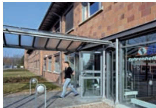
Das BITZ im Technologiepark Bremen.

Zum Jubiläum freut man sich nicht nur über ein erfolgreiches Modell, sondern auch, dass der ADT-Bundesverband der Technologiezentren sich mit 120 Teilnehmern im Mai in Bremen treffen und über Standortentwicklung durch Technologiezentren diskutieren wird. Im Gründerzentrum in der Airport-Stadt lassen sich vor allem Hochschulabsolventen nieder. Über das einstige Bundesprogramm BRIDGE und jetzt von der Universität und Hochschule Bremen sowie den Wirtschaftsförderern eigenständig weitergeführte Programm werden potenzielle Gründer bereits im Studium konti-