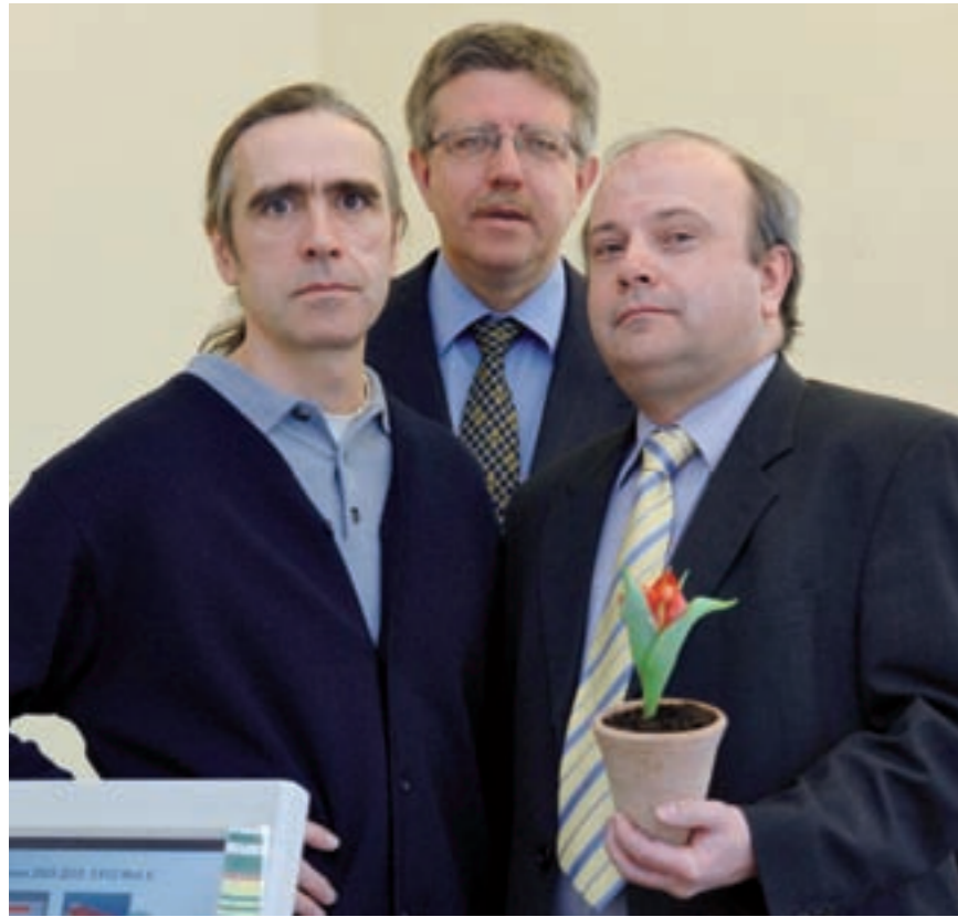
Die drei Ingenieure von Balance Technology können auf kontinuierliches Wachstum zurückblicken.

Vielleicht auch oder gerade weil junge Unternehmer im kleinsten Bundesland auf ein breites Netzwerk an Beratungs- und Fördermöglichkeiten zurückgreifen können. Das Netz ist mit insgesamt 14 Partnern engmaschig geknüpft. Ob die Kammern, die Arbeitsagenturen, die Hochschulinitiative BRIDGE oder aber die Bremer Aufbau-Bank GmbH und die Wirtschaftsförderer der BIG-Gruppe – beim Thema »Sprung in die Selbstständigkeit« arbeiten sie zum Wohl der Standortsicherung und des Strukturwandels engagiert Hand in Hand. Denn Existenzgründung, dahinter verbirgt sich nicht nur der Wunsch, sein eigener Chef zu sein, die anhaltende Gründungswelle hat sich auch zum erfolgreichen Instrument der Wirtschaftsförderung entwickelt.